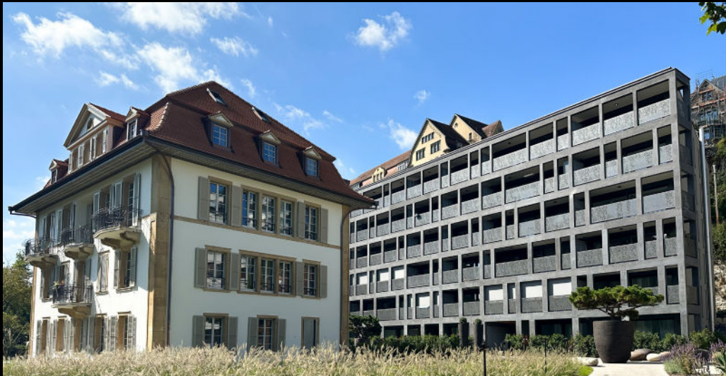
villa & parc verdan - bienne