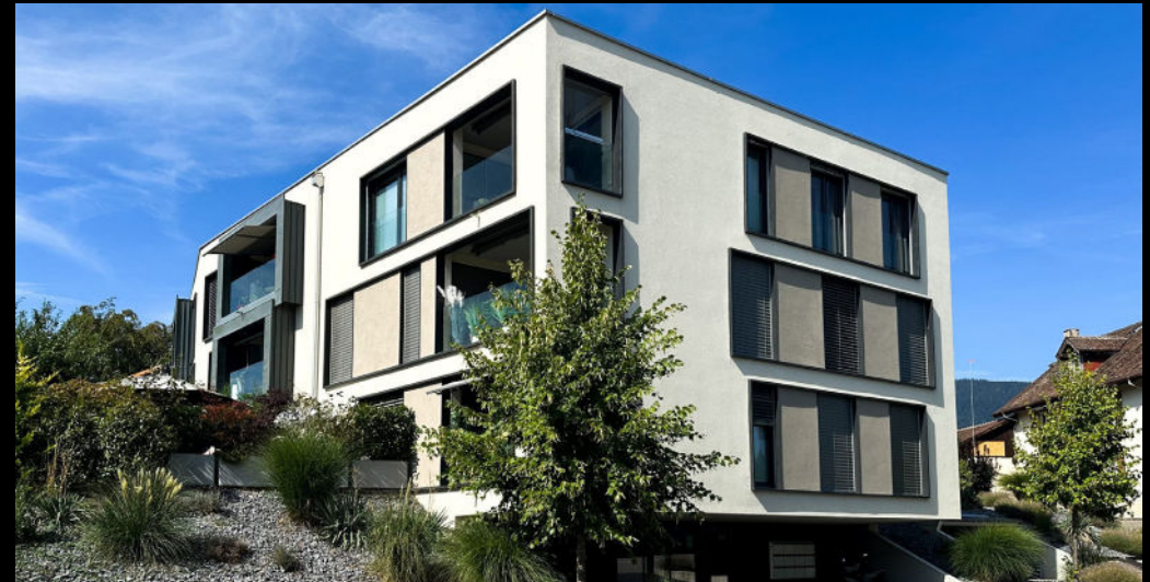
vergers 9 - cortailod