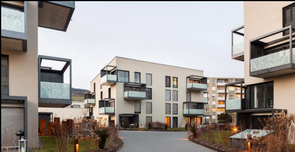
bas-du-ruisseau - le landeron