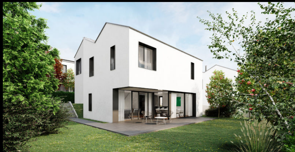
vignes-rondes - cressier