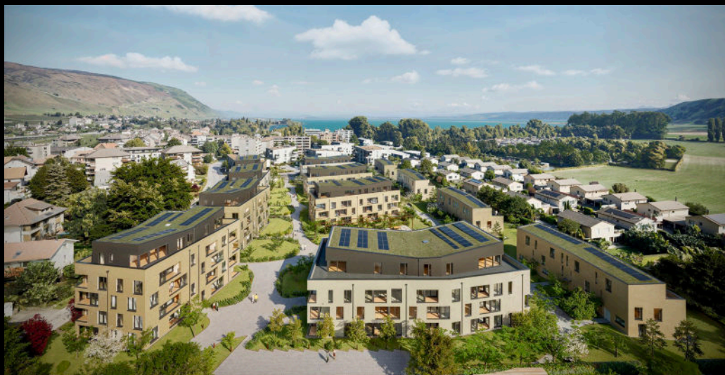
les pêches derrière l'église - le landeron