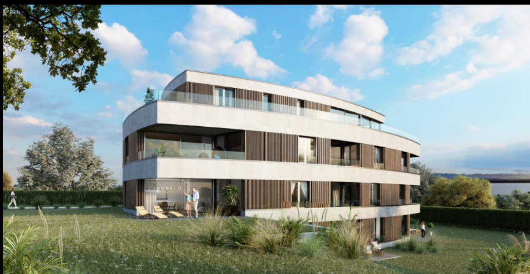
résidences du château - bevaix