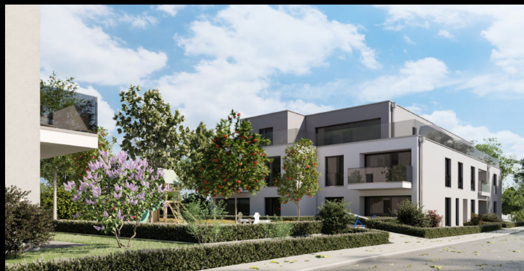
résidences île st-pierre - erlach