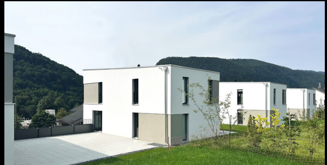
parc soleil - péry